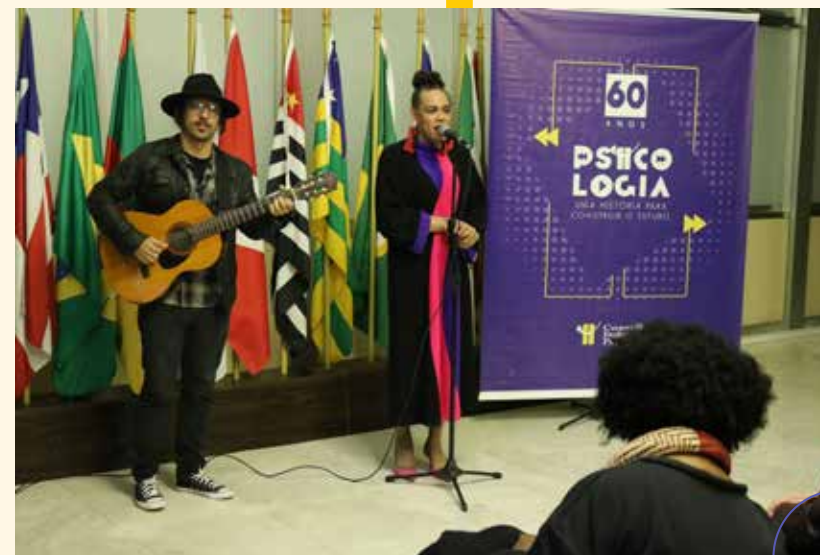
Sofia Cavedon Deputada estadual (PT)

“É uma ciência que dialoga com os processos humanos e com a luta pela liberdade, comprometida pelas lutas de transformação social no país, marcada pelo compromisso ético, científico e político e agente ativa nas transformações sociais”.